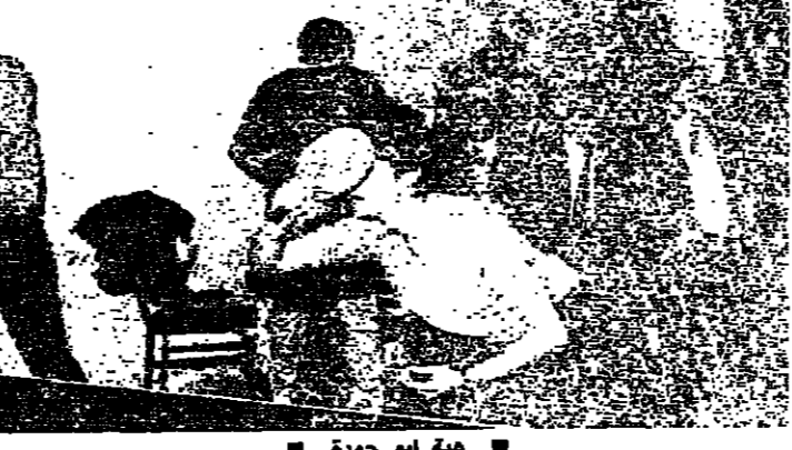
هبة ابو جودة